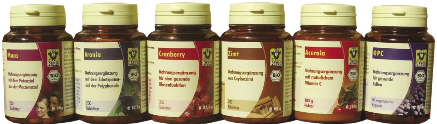
Ein Teil des breiten Nahrungsergänzungsmittel-Angebots

Das Unternehmen erweiterte nach und nach die Zahl seiner Produkte und platzierte immer wieder Verkaufshits auf dem Markt: Raab Vitalfood brachte zum Beispiel 1998 Apelessigtabletten in die Reformhäuser, kurz danach war die Firma auch mit Pu-Erh-Tee, dem Schlankheitsgetränk, Aloe und Noni, Trendsetter.